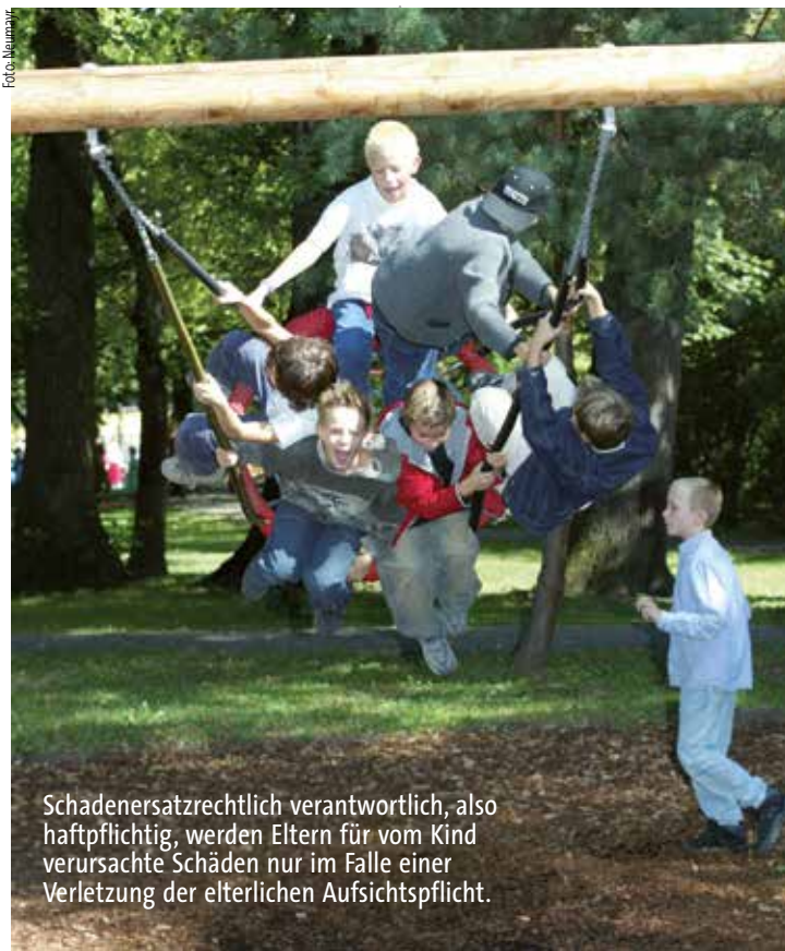
Schadenersatzrechtlich verantwortlich, also haftpflichtig, werden Eltern für vom Kind verursachte Schäden nur im Falle einer Verletzung der elterlichen Aufsichtspflicht.

Können wir schon „die Kinder nach unserem Sinne nicht formen“, wie Goethe sagte, so schafft das Gesetz durchaus einen sachgerechten Ausgleich zwischen den Interessen der Eltern an notwendigen Freiräumen für ihre Kinder und den berechtigten Anliegen Dritter, Ersatz für durch Kinder erlittene Schäden zu erhalten.