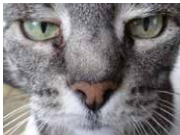
WENN DAS PARKETT Katzenkrallen nicht standhält, ...

den erhalten. Der Kläger kaufte daher bei einem Baumarkt für die drei Räume seiner Wohnung ein Fertigparkett. Da der Kläger Katzen hält, erkundigte er sich vor dem Kauf beim Baumarkt nach dem Härtegrad des Bodens. Dem Kläger wurde die vom Hersteller eingeholte Auskunft weitergegeben. Daraufhin entschloss er sich zum Kauf und verlegte das Fertigparkett. Schon wenige Monate nach der Verlegung waren Kratzspuren, die von den Katzen verursacht wurden, im Boden sichtbar. Der Boden wies nicht den zugesagten Härtegrad auf. Der Käufer verlangte deshalb – gestützt auf Gewährleistung – unter anderem die Rückerstattung der Kosten für den Aus- und Einbau.