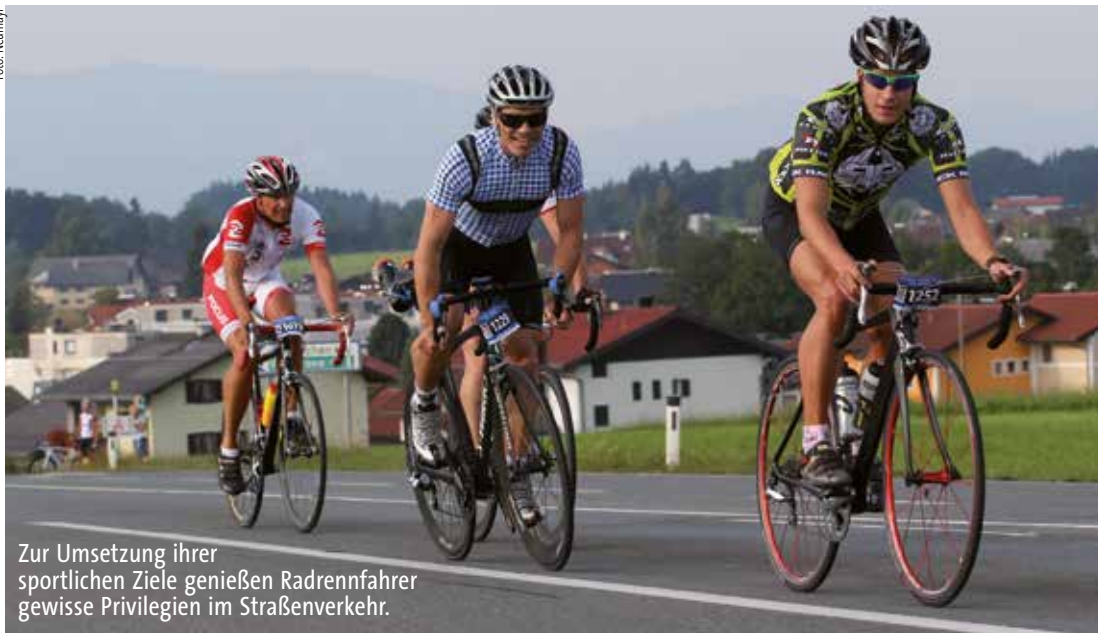
Zur Umsetzung ihrer sportlichen Ziele genießen Radrennfahrer gewisse Privilegien im Straßenverkehr.