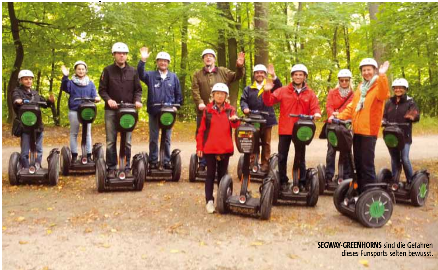
SEGWAY-GREENHORNS sind die Gefahren dieses Funsports selten bewusst.