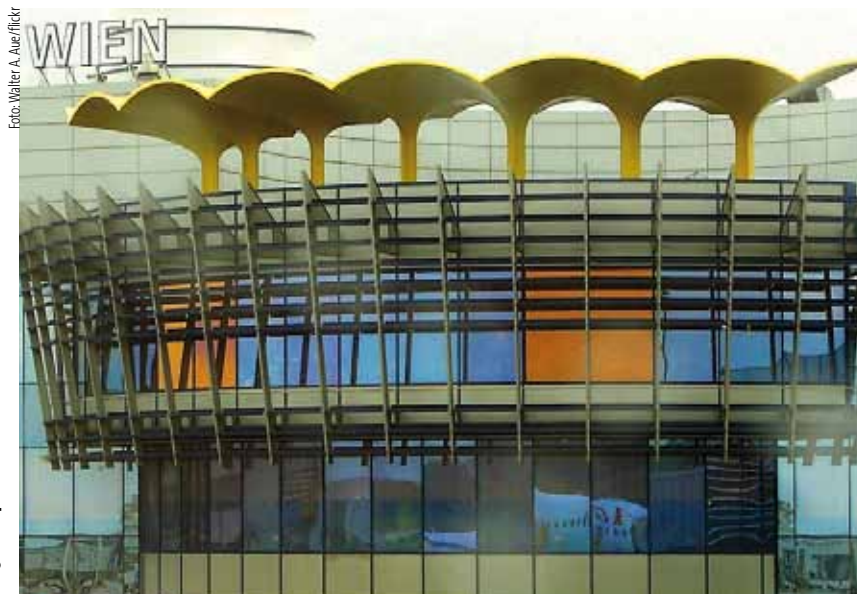
WER HAFTET bei Unfällen im Flughafen?

Nicht der Flughafen • die Fluglinie haftet