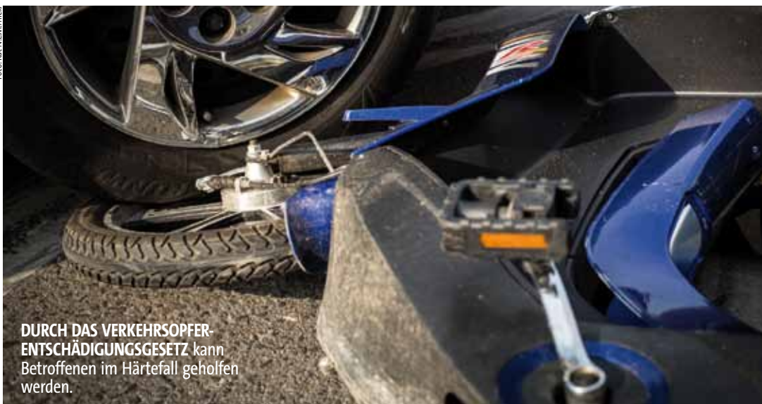
DURCH DAS VERKEHRSSOPFER-ENTSCHÄDIGUNGSGESETZ kann Betroffenen im Härtefall geholfen werden.